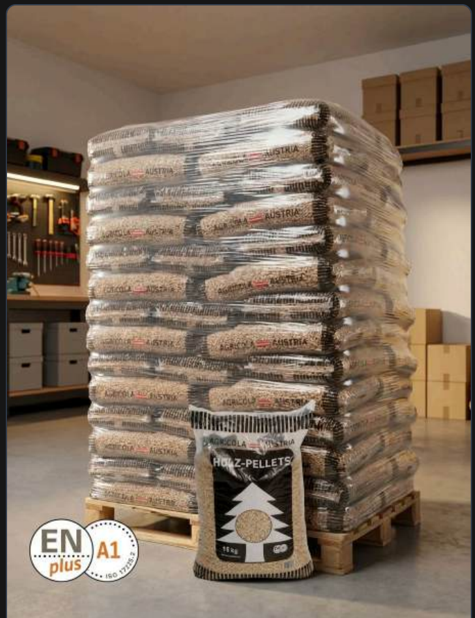
ALT: Agricola Pellets Zak 15kg – Enplus A1 - Agricola Pellets Zak 15kg – Enplus A1 - Afbeelding 4