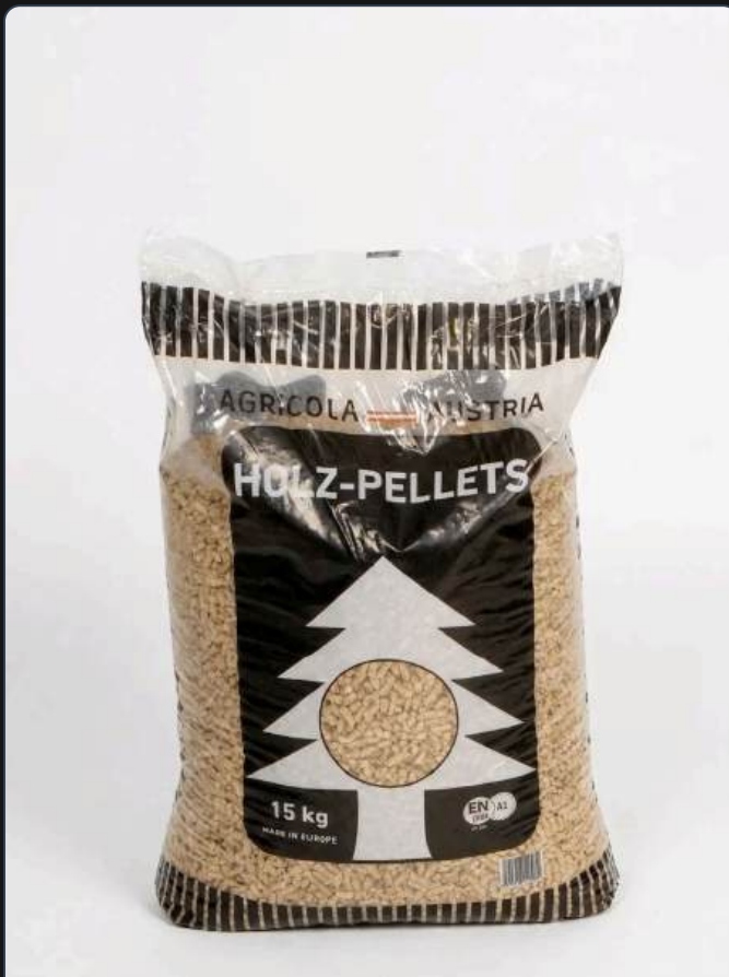
ALT: Agricola Pellets Zak 15kg – Enplus A1 - Agricola Pellets Zak 15kg – Enplus A1 - Uitgelichte Afbeelding File: agricola-pellets-zak-15kg-enplus-a1-agricola-pellets-zak-15kg-enplus-a1-uitgelicht.webp