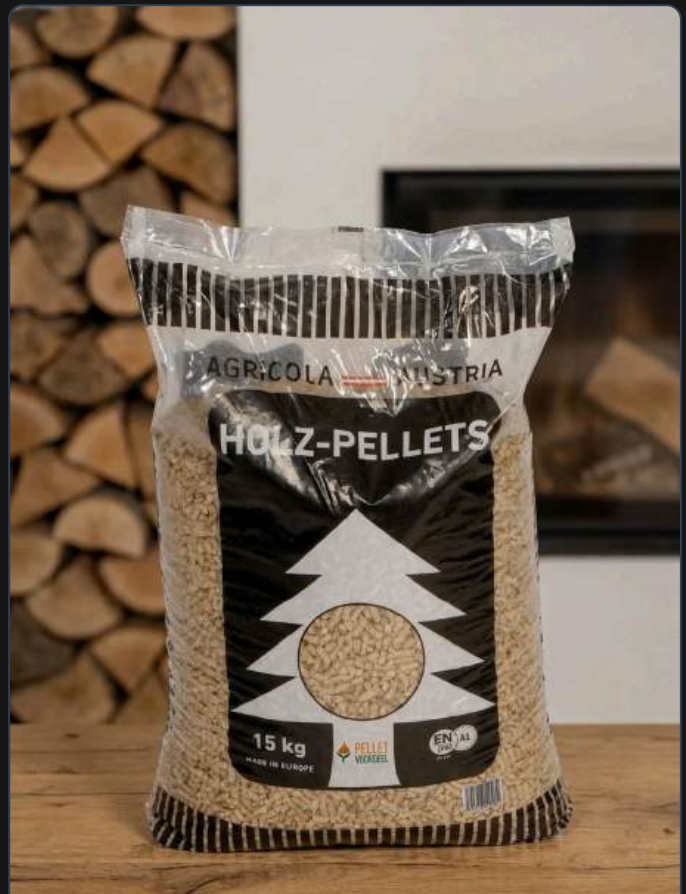
ALT: Agricola Pellets Zak 15kg – Enplus A1 - Agricola Pellets Zak 15kg – Enplus A1 - Afbeelding 2 File: agricola-pellets-zak-15kg-enplus-a1-agricola-pellets-zak-15kg-enplus-a1-afbeelding-2.webp