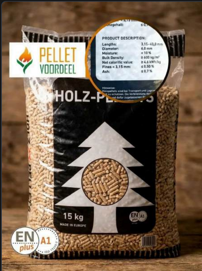
ALT: Agricola Pellets Zak 15kg – Enplus A1 - Agricola Pellets Zak 15kg – Enplus A1 - Afbeelding 5 File: agricola-pellets-zak-15kg-enplus-a1-agricola-pellets-zak-15kg-enplus-a1-afbeelding-5.webp